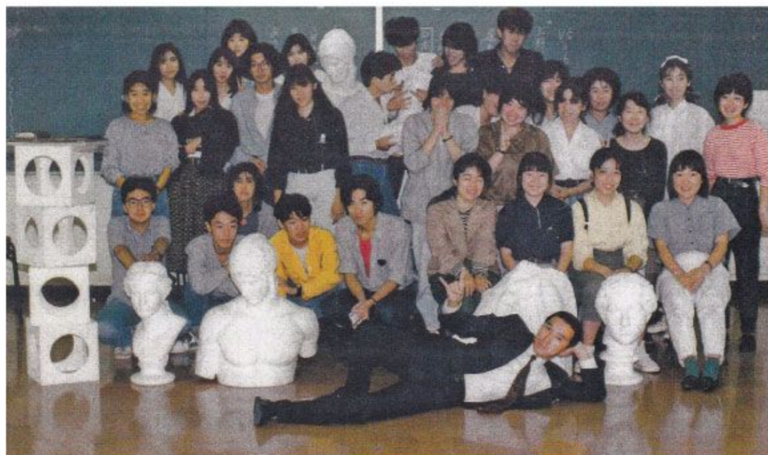
東デ教員時代（38歳）授業終了時の集合写真。この頃は青枢展見学に学生を400名余り引率されていたそうです。

他にも居合道2段・囲碁初段・般若心経読経歴50年、ついでに披露しちゃうと瞑想歴40年、自身で散髪30年、毎朝奥様と握手をして出勤される事35年余り（え、不思議？ですが）、などなど…すごいコダワリの習性？ですが、作品にもそのあたりの影響が見えてきて、興味深いです。作家というのは、大なるオタクであるからこそ、続けられるものなのかもしれませんね。