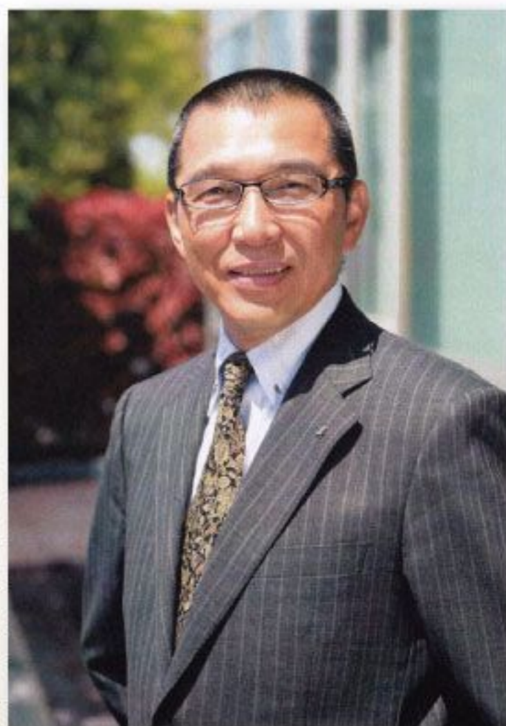
現在は高崎健康福祉大学で勤められ、多摩美術大学校友会理事・藤岡市民展審査委員と多方面で活躍されています。スーツ姿もさすがが決まっていますね。