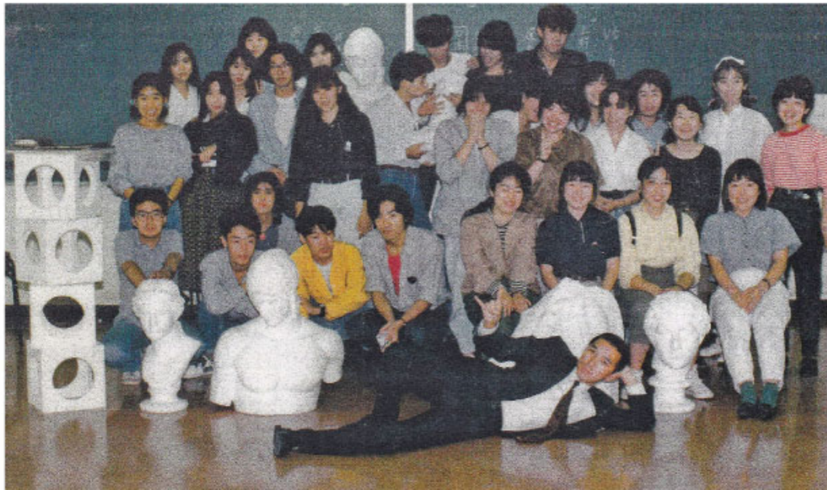
東デ教員時代（38歳）授業終了時の集合写真。この頃は青枢展見学に学生を400名余り引率されていたそうです。

他にも居合道2段・囲碁初段・般若心経読経歴50年、ついでに披露しちゃうと瞑想歴40年、自身で散髪30年、毎朝奥様と握手をして出勤される事35年余り（え、不思議？ですが）、などなど…すごいコダワリの習性？ですが、作品にもそのあたりの影響が見えてきて、興味深いです。作家というのは、大いなるオタクであるからこそ、続けられるものなのかもしれませんね。