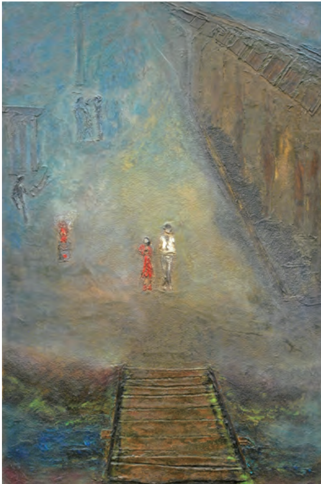
P80 記憶の門・橋の向こう

「作者自身が眼病に冒され、失明の危機・恐怖との闘いの中での実体験から、この連作が生まれたという。絵描きにとって、見えなくなるというのは死んでも同然の恐ろしさでありましょう。画家が世界を知覚するのは自身の眼であり、見るという行為は表現の入り口であり出口でもある訳です。そんな不安と向き合い、5つの切り口で表現された連作は、鑑賞者に静謐でありながらも重量感のあるメッセージを発しているようです。強い存在感を持つこの作品は、受賞に相応しいという審査員の賛同を得た力作であります。」 選評・米谷