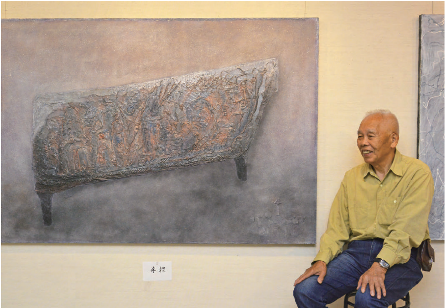
新作 (P100 手探) の前にてポーズ

まずは会場を一巡して、今回の大作のひとつ、「手探」の前でポーズしてもらい、テーブルに移動してから、若き日、ふる里・北九州での事の始まりから順に語っていただきました。